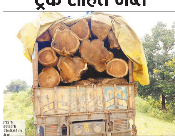
ट्रक के साथ जब्त की गई लकड़ी।