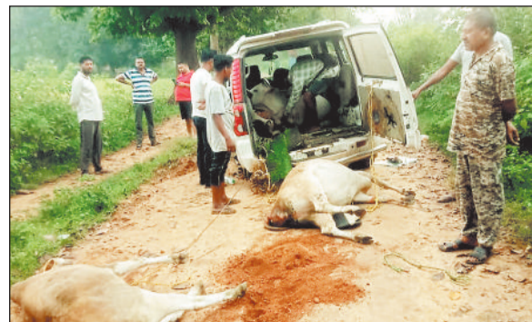
पिकअप से गौवंश बरामद करती पुलिस।

जशपुरनगर। चार दिनों के भीतर लोदाम थाना, पंडरापाठ चौकी व करडेगा चौकी क्षेत्र में की गई अलग-अलग कार्रवाई में पुलिस ने कुल 25 गौवंशों को आरोपियों के चंगुल से मुक्त कराया है। इस दौरान पुलिस तत्काल मौके पर पहुंची और भेजा गया है। अन्य आरोपी फरार है। पुलिस ने तस्करी में प्रयुक्त दो पिकअप और एक स्कॉर्पियो वाहन भी जब्त किया है।